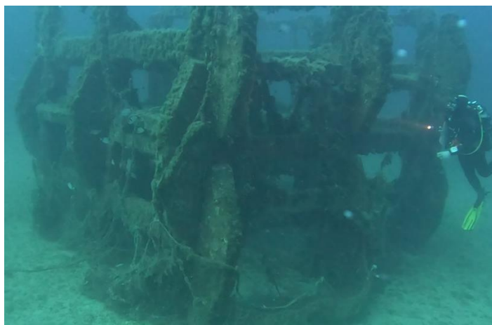
Plongée sur les récifs artificiels

A fin septembre, les algues filamenteuses sont encore bien présentes jusqu'à 25m. Elles commencent à disparaître à partir de 30m.