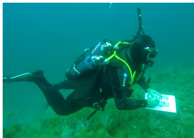
relevé sur les herbiers